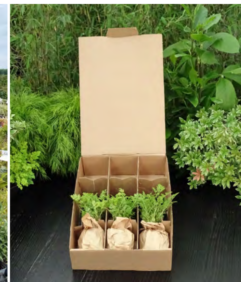
Coque en carton recyclé pour godets