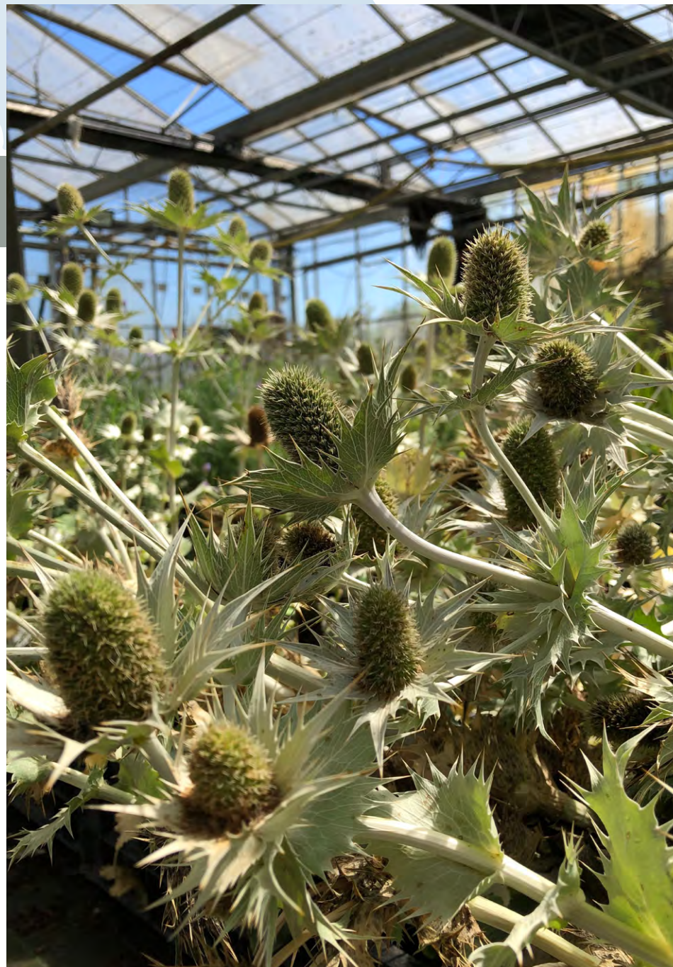
Panicauts géants dans les serres

» Depuis 3 ans, nous expérimentons une approche nouvelle pour le marché : l'instauration d'engagements d'achats pluri-saisonniers. Il s'agit de réservations de commandes pour deux saisons d'activité, qui portent sur des productions déjà plantées par les producteurs et sont payées à la livraison. Cette approche est inédite car le contrat prévoit une clause d'indemnisation du producteur en cas de réservation non honorée par Promesse de fleurs.