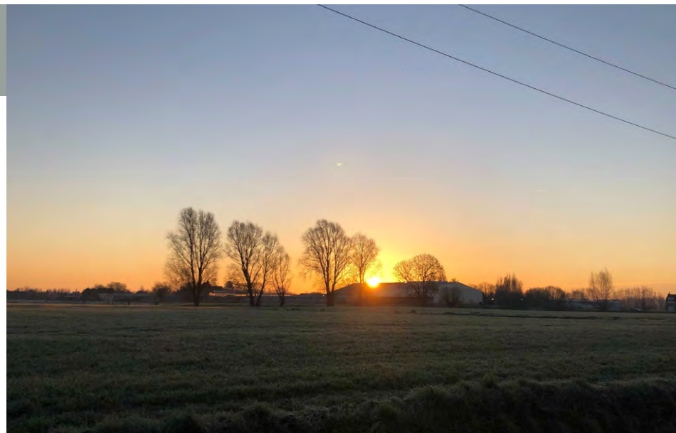
Coucher de soleil sur les serres