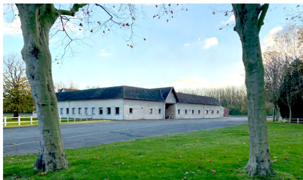
La ferme au carré de Premesques

» Ce projet nous tient à coeur car il nous permettra non seulement d' agrandir nos surfaces d'exploitation (serres, installations pour la préparation des commandes et des expéditions) mais également de renforcer notre ancrage territorial en accueillant un programme destiné à favoriser la formation et l'installation de jeunes horticulteurs sur 32 ha de terres agricoles.