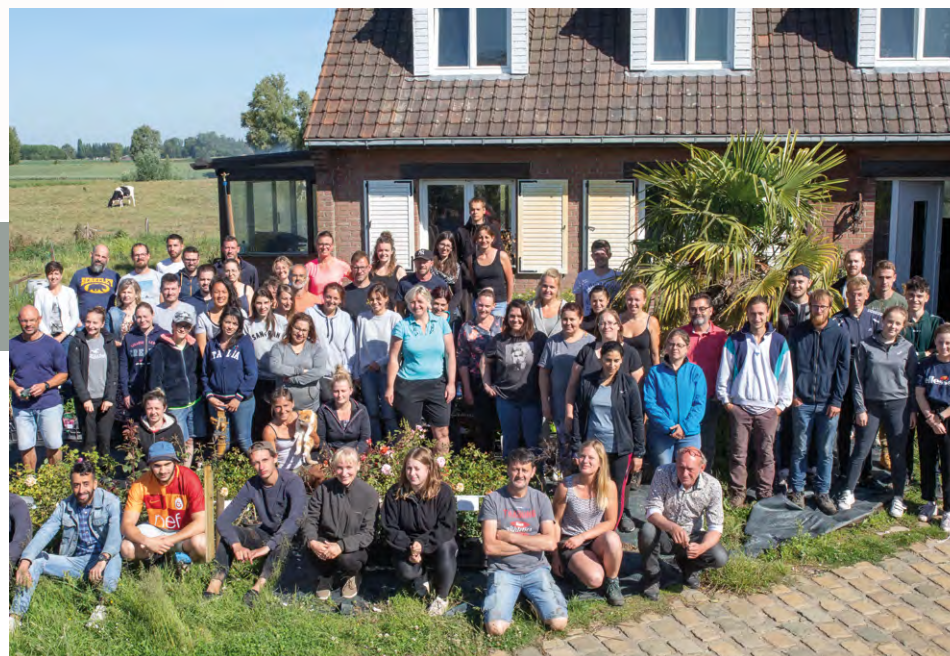
Photo de groupe devant les bureaux

» L'employabilité est une notion importante : nous développons la polyvalence de nos collaborateurs. Chacun maîtrise au moins trois fonctions (préparation de commande, contrôle végétal et emballage pour l'activité pépinière). Nous formons, privilégions la promotion interne et effectuons beaucoup de changements de postes transversaux. Ainsi, la moitié des équipes du service clients a démarré en exploitation et 7 responsables d'équipe sur 10 ont démarré comme employés.