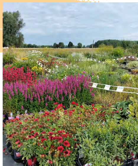
Espaces extérieurs au mois de juin

» En expédiant 100% de nos commandes sans plastique d'ici 2025. Nous cherchons actuellement des solutions pour nos déchets plastiques non recyclables: films et barquettes dans lesquels nous recevons les plantes des producteurs.