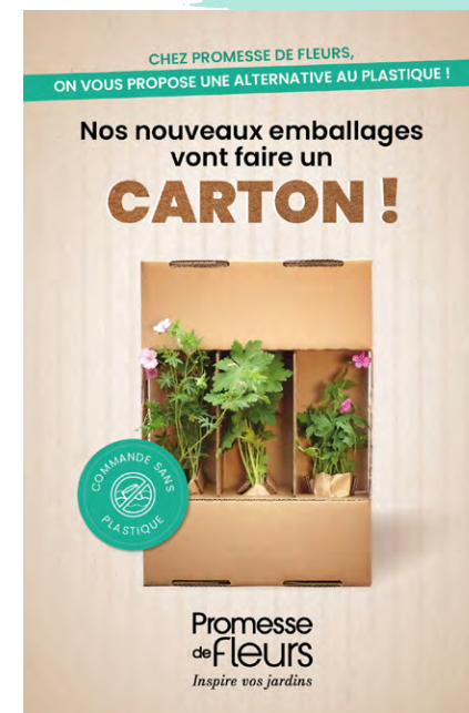
Affiche de lancement du service

Avec les Paniers Bons Plants, nous proposons des paniers anti-gaspillage à petits prix (25% du prix de vente) : des invendus non conformes ou abîmés mais encore viables, qui reprendront vie dans les jardins avec un peu de soin. Ce nouveau service, mis en place depuis juin 2022, a permis de sauver plus de 6000 plantes. Nous proposons également nos paniers sur l'application Too Good To Go.