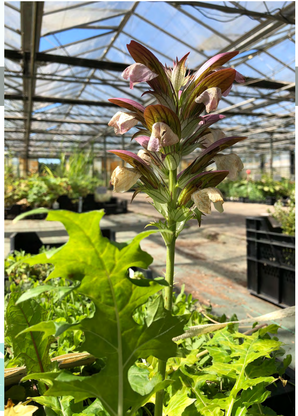
Acanthus Hungaricus dans les serres en juillet

Pour chaque végétal, nous affichons une photo tel que livré aux 4 saisons, y compris - et surtout - si la variété est visuellement peu attractive à cette période.