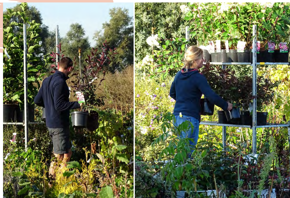
Rangement des serres ; picking des commandes

Dans un secteur qui recrute beaucoup d'emplois saisonniers, nous donnons des perspectives de formation. En 2022, nous avons proposé 450 heures de formation, sur 4 thématiques prioritaires. D'ici 3 ans, nous souhaitons offrir une formation par an et par collaborateur, sur tous les métiers et sur tous les postes de l'entreprise.