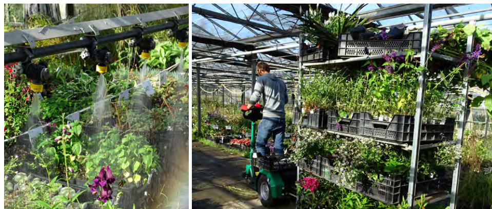
Arrosage raisonné et véhicule électrique dans les serres

La Ferme de Premesques est un bâtiment basse consommation grâce à l'isolation thermique des bâtiments et aux panneaux solaires sur les toits des entrepôts, qui couvriront 100% de nos besoins en électricité. Le chauffage des bureaux sera assuré en énergie renouvelable par une chaudière à granules de bois. Nous ne chauffons pas nos serres et 90% de nos équipements sur l'exploitation – une trentaine d'engins – sont électriques.