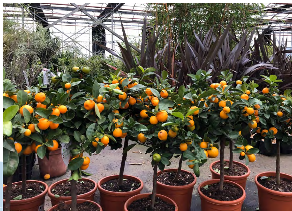
Arrivage de Kumquat Fukushu dans les serres

100% de nos fournisseurs végétaux évalués dans une grille RSE d'ici 2026.