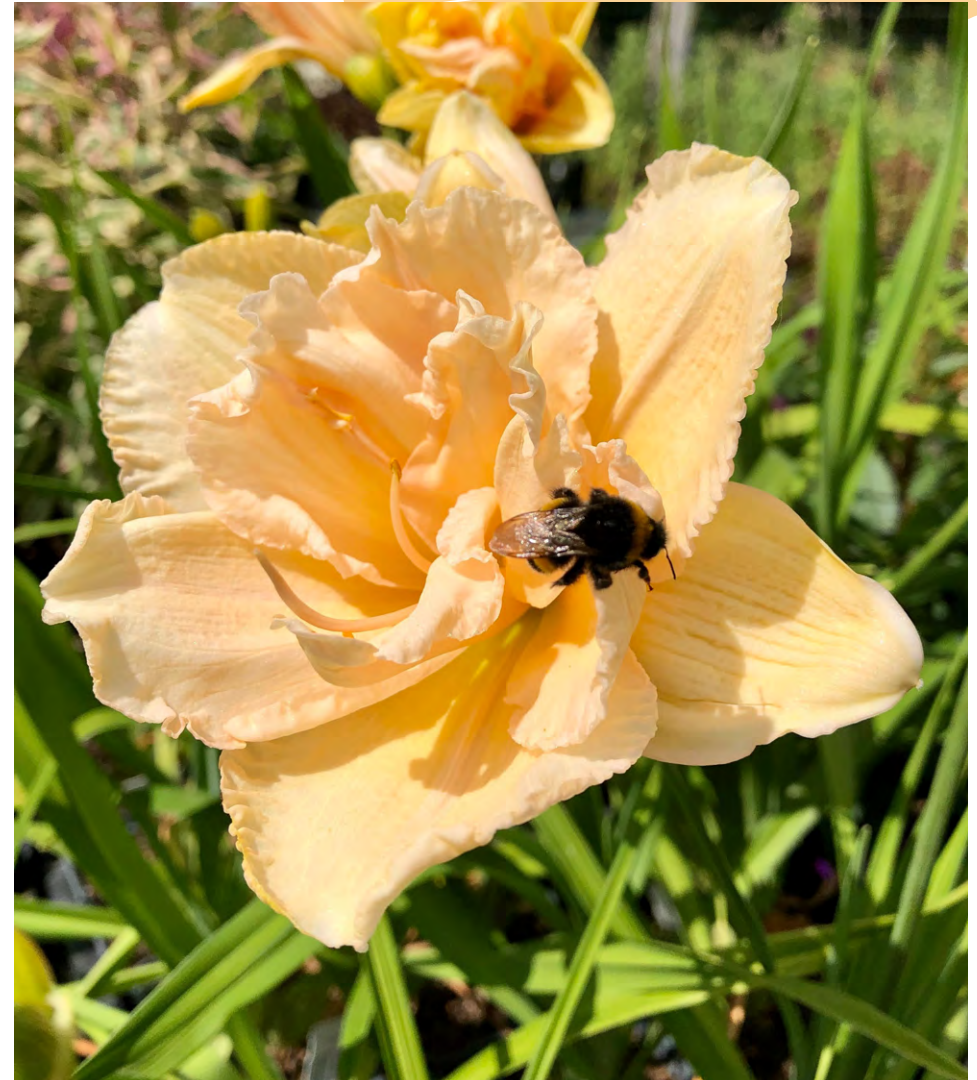
Butinage dans les pâtures sur les hémérocailles Land of Cotton

Nous souhaitons accroître la transparence sur nos produits, réduire nos impacts environnementaux et impliquer nos parties prenantes dans notre démarche de progrès.