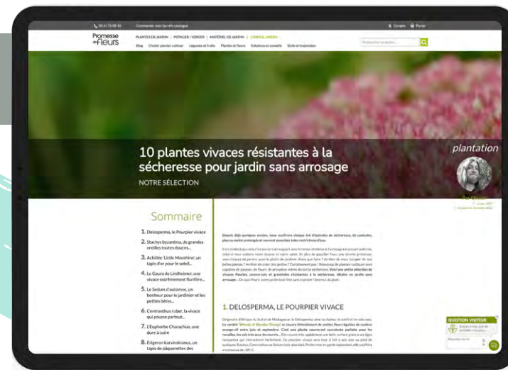
Article rubrique Conseils jardin sur promessedefleurs.com