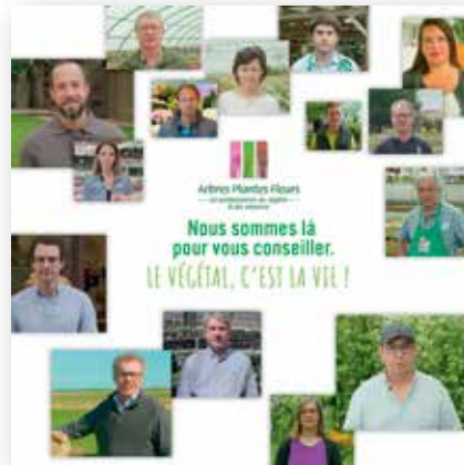
Bannière de la campagne TV "Le végétal, c'est la vie !" diffusée sur internet et les réseaux sociaux.

VAL'HOR a par ailleurs bénéficié d'un soutien de FranceAgriMer pour l'étude d'impact de la Covid-19 sur la filière et pour le spot TV « Le végétal, c'est la vie ! » diffusé sur TF1, France TV et BFM TV près de 200 fois du 18 mai au 7 juin 2020.