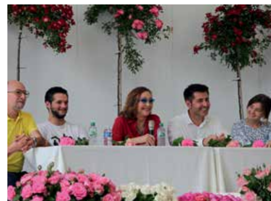
Conférence de presse pour La Fine Fleur au parc de Bagatelle, le 17 juin 2021.

Depuis 2019, les relations presse grand public développées par VAL'HOR se sont renforcées. En début d'année 2021, VAL'HOR a conclu un partenariat inédit avec la société de distribution Diaphana à l'occasion du film « La Fine Fleur » réalisé par Pierre PINAUD. À travers Ève, productrice de roses incarnée par Catherine FROT, ce sont tous les professionnels du végétal et leur savoir-faire qui ont été mis en lumière. Dans le cadre de ce partenariat, une campagne de communication d'envergure a été menée auprès du grand public (plus de 6 000 panneaux d'affichage au niveau national) incluant une campagne digitale puissante, diffusée notamment sur France Télévisions replay et de nombreux réseaux sociaux totalisant plus de 5 millions de vues. Cette campagne a été relayée par plus de 1 000 professionnels au sein de leurs points de vente dans toute la France, grâce à des kits de communication offerts par VAL'HOR pour valoriser les métiers-passion du végétal.