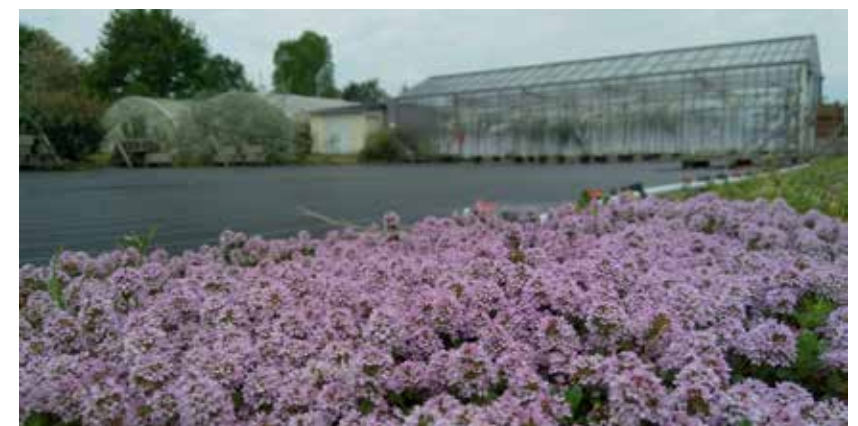
Thymus longicaulis en couvre-sol.