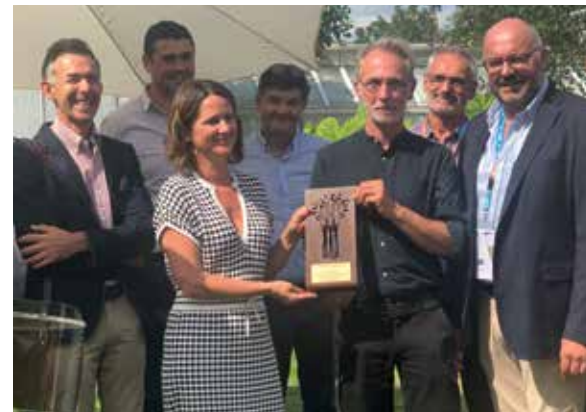
Remise du Grand Prix des Victoires du Paysage à la maire de Nantes en septembre 2021.

Organisées tous les 2 ans, les Victoires du Paysage représentent aujourd'hui un événement majeur pour le paysage. Véritable vitrine du savoir-faire de la filière ainsi que des innovations et des tendances dans le secteur, ce concours est un outil de médiatisation important des donneurs d'ordre qui s'engagent pour la qualité de vie en travaillant avec les professionnels du paysage. La remise des Prix de la 7 e édition des Victoires du Paysage s'est déroulée en format digital jeudi 20 mai 2021 et a été suivie en direct par plus de 1 000 personnes. Elle a mis en lumière 37 lauréats : collectivités, entreprises et particuliers. Depuis, des remises de Prix sur le terrain permettent de célébrer les équipes professionnelles et les maîtres d'ouvrage.