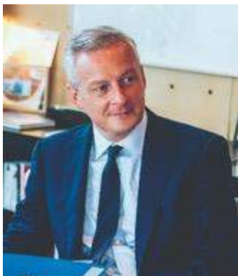
Bruno Le Maire ministre de l'Économie des Finances et de la Relance