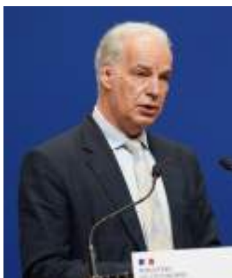
Alain Griset ministre délégué chargé des Petites et Moyennes Entreprises

L'entrepreneuriat connaît un nouveau dynamisme porté par le développement de formes nouvelles d'organisations et de modalités du travail, et par la transformation profonde des aspirations individuelles de chacun, notamment parmi les jeunes générations.