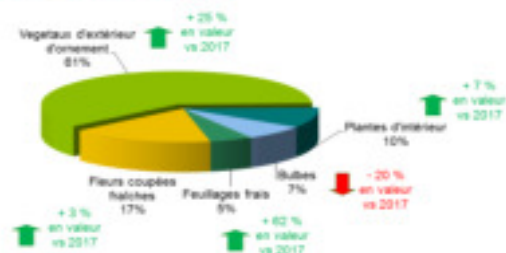
Parts de marché des exportations françaises parts de marché en valeur et évolution en valeur de janvier à septembre 2018 versus la même période en 2017 Valeur : 53 millions € (+ 15 % vs 2017)

* excepté les boutures de vigne (06021010), plants de vigne (06022010), blanc de champignons (06029010) et plants d'ananas (06029020); Plants, arbres ou arbustes de comestibles