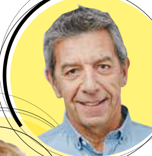
MICHEL, LE DOCTEUR

Fort du succès exceptionnel de ses magazines ( Dr Good, Dr Good C'est bon, Dr Good Kids ), le groupe Reworld Media, avec le groupe Webedia, poursuit sa stratégie de diversification avec le lancement d'une nouvelle déclinaison Dr Good Véto .