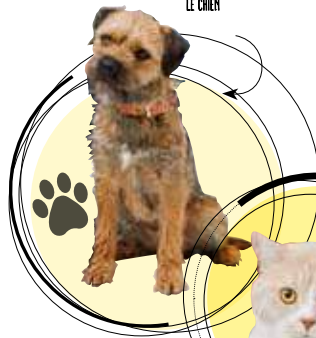
COLONEL, LE CHIEN