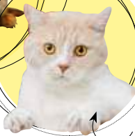
TEDDY, LE CHAT