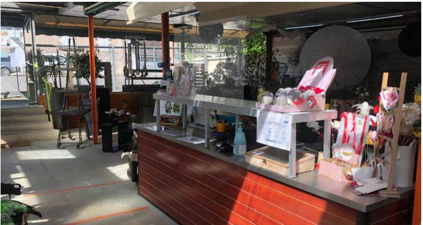
Fleuristerie - Jardinerie