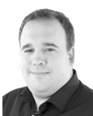
SERGE BRIET - TRUFFAUT Graine d'Or en Animal de compagnie - Univers Oiseaux, Petits mammifères et Animaux de la nature