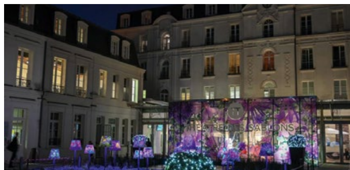
Théâtre des Sablons à Neuilly-sur-Seine (92).