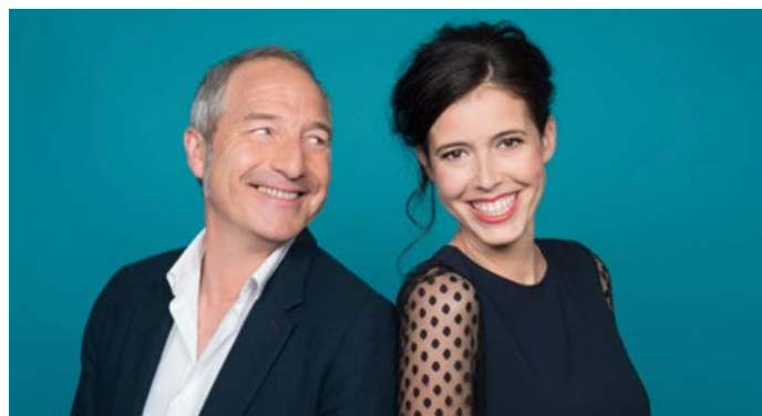
Stéphane Marie et Carole Tolila de l'émission Silence ça pousse, en présentateurs vedettes de ces 34 e Graines d'Or.