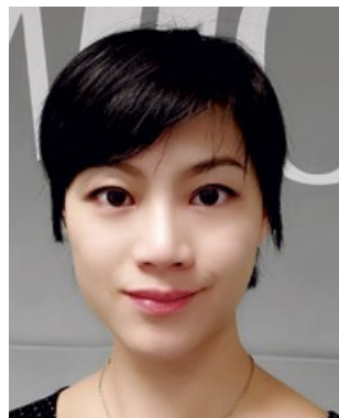
JUN HUCBOURG, GAMM VERT - INVIVO RETAIL Graine d'Or en Matériels de jardinage