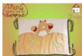
Hamac Titi ou Tapis fond de cage pour furet ***RHINO***