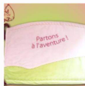
Tapis et Hamac Aventure - Rose et vert