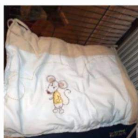
Hamac et Tapis Souris