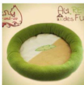
Couffin d'automne pour furet - vert et

Alors si toi aussi, tu es un Fufu-Écolo dans l'âme et que tu veux donner une seconde chance à ces dodos, clique sur les images pour qu'ils te racontent leurs histoires :