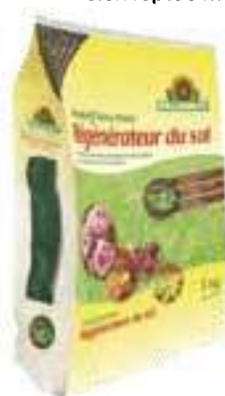
⑤ Un sol chouchouté Régénérateur de sol Terra Preta Neudorff