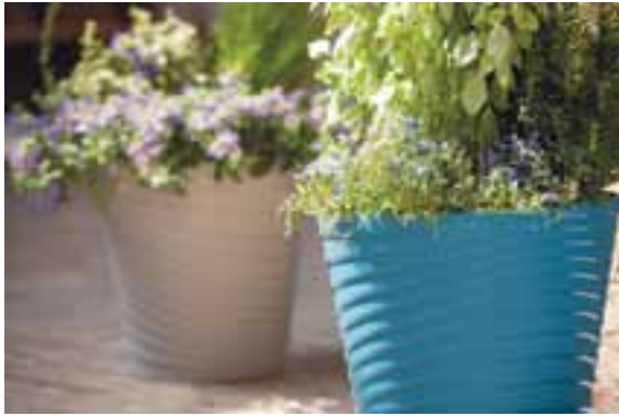
① Une forme à faire tourner la tête ! Vaso Slinky Deroma