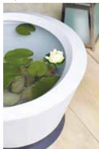
④ Créez un jardin aquatique IK2 gamme Ikône d'Eda Plastiques