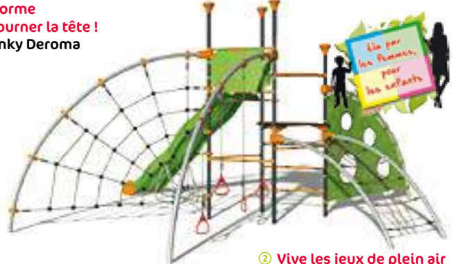
② Vive les jeux de plein air Structure de jeux Evo Costo de Trigano