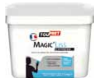
⑧ C'est blanc, c'est sec ! Magic'Liss Express de Toutpret