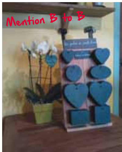
⑥ Des étiquettes végétales au jardin ! Étiquettes Un Jardin en Pente Douce