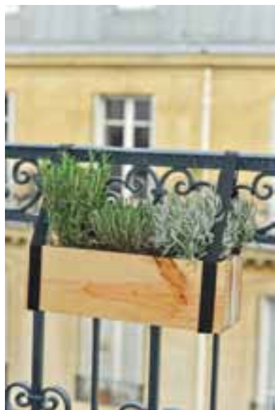
① Une balconnière à offrir Caisse cadeau 'Monbalconparisien.fr'