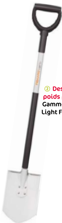
② Des outils poids plume Gamme Light Fiskars