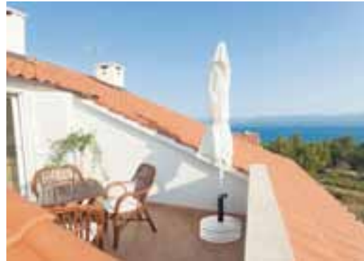
② On rempile ! Hoopla