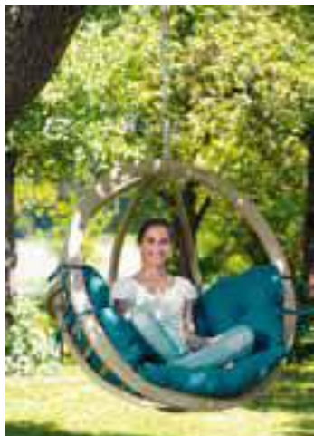
① Ça balance pas mal ! Globo Chair d'Amazonas