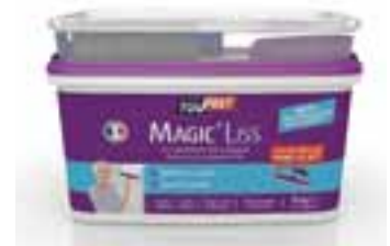
⑧ L'enduit facile ! Magic'Liss de Toupret