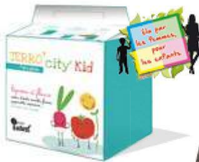
③ Jardiner au naturel Terro' City® Kid, Premier Tech Horticulture Faliénor