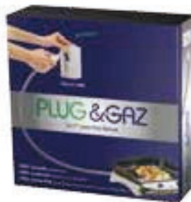
⑦ Gaz : une prise et ça marche ! Système Plug and gaz de Culture Energie France