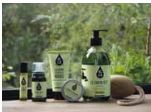
⑥ Des soins aux huiles essentielles Gamme Nature de LCA