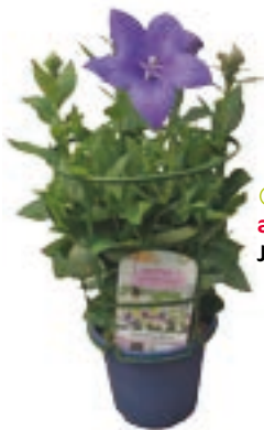
⑥ Plantes aux couleurs de l'été Jardin d'Été de Corma