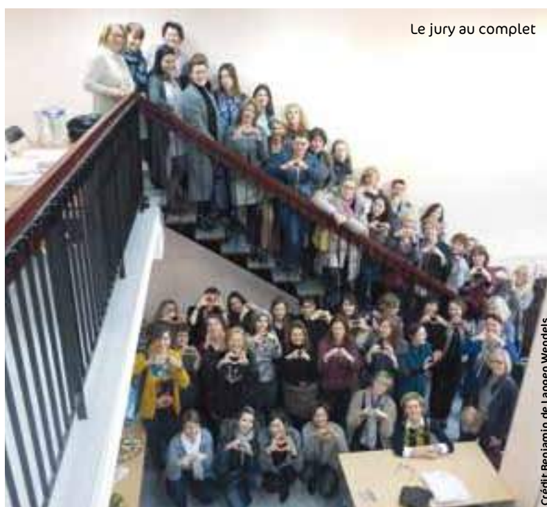
Le jury au complet

Notre jury 100 % féminin, présidé par Yolaine de la Bigne et composé de 75 expertes sur les marchés du jardin, de la maison et de l'animal de compagnie a finalement tranché. Ces expertes ont ainsi accordé le précieux label à 34 produits, lors d'une cérémonie qui s'est tenue le 8 mars, dans les locaux de TF1. Et récompense suprême, parmi ces produits labellisés, notre jury a décerné ses 4 'grands prix du jury' à des produits malins et inventifs, qui les ont fait particulièrement vibrer.