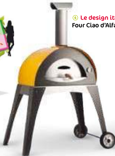
④ Le design italien au jardin... Four Ciao d'Alfa pizza