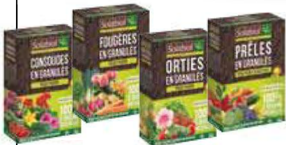
⑥ Soigner les plantes... par les plantes Gamme d'extraits végétaux en granulés Solabiol