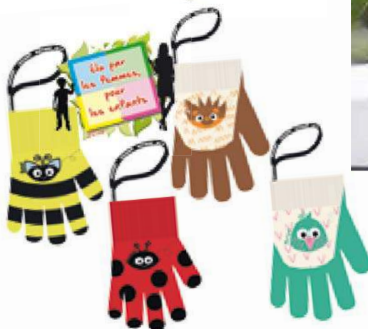
⑦ Des gants ludiques et rigolos Gants de protection Rostaing