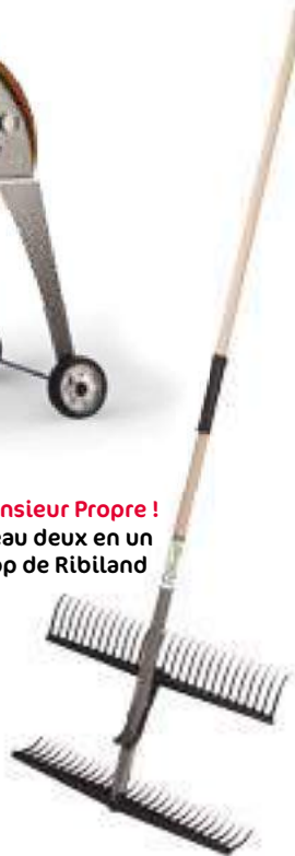
⑦ Monsieur Propre ! Râteau deux en un Foli'op de Ribiland