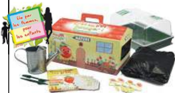
④ Mon premier potager clef en mains Kit Mon P'tit potager marque Nature