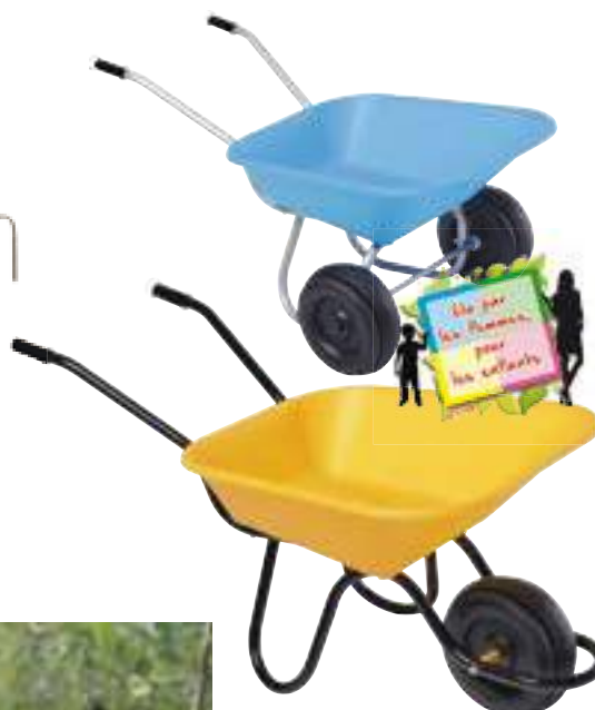
⑦ Ma mini brouette fait le maximum ! Brouette mini Haemmerlin CDH Group