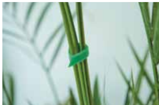
③ En lien avec les végétaux Lien rapide Ribiland