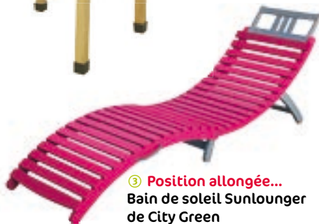
③ Position allongée... Bain de soleil Sunlounger de City Green