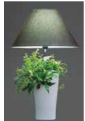
⑤ Lumière, ça pousse ! Lampe végétale Lumipouss