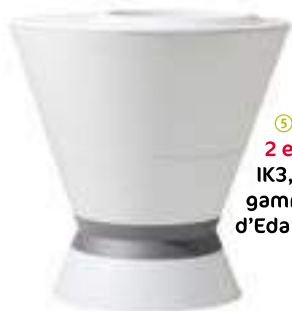
⑤ Un contenant 2 en 1 IK3, gamme Ikône, d'Eda Plastiques