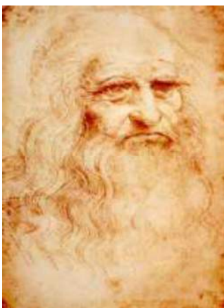
Léonard De Vinci