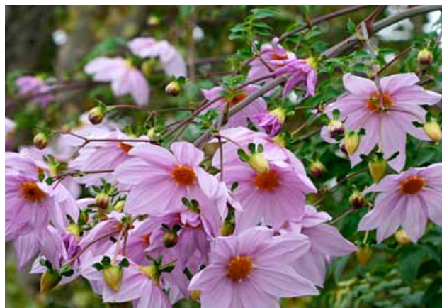
▲ Dahlia imperialis

Après une campagne de restauration et de restitution entreprise entre 2011 et 2013, le Jardin Anglais s'apprête à accueillir deux fois par an, les Journées des Plantes de Courson transmises, désormais, au Domaine de Chantilly.