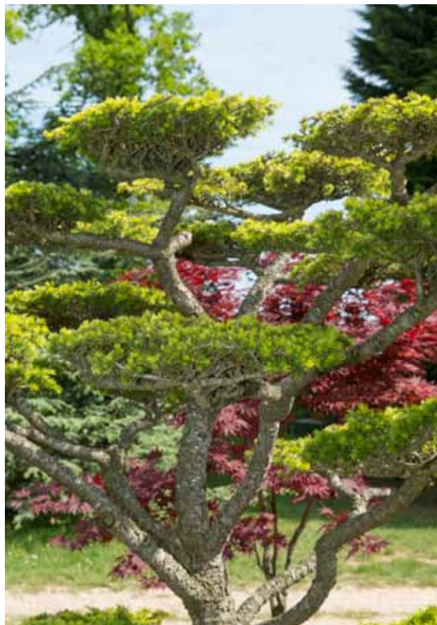
▲ Arbre taillé en nuages

Des variétés nouvelles et inédites ou rares présentées chez Boos Hortensia dont le Mérite de Courson, printemps 2014 H. macrophylla 'Wedding Gown' ou celui du printemps 2013, H. paniculata 'Sparkling'. Les Hortensias du Haut-Bois proposeront des sujets adultes exceptionnels par leur taille mais aussi des jeunes plants de 2 ans.