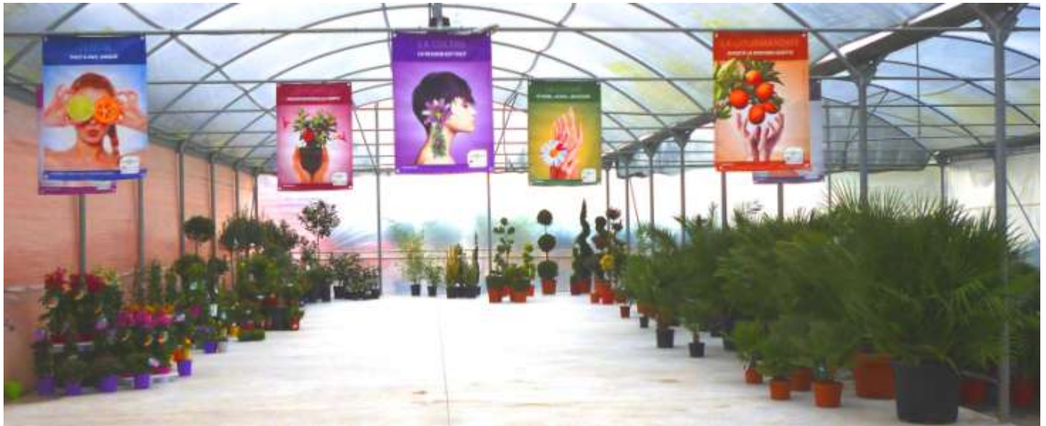
Journée des portes ouvertes chez Jardiservice, un rendez-vous traditionnel lors de l'ouverture de la saison.