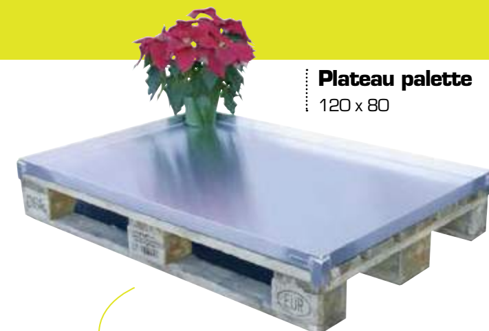
Plateau palette 120 x 80