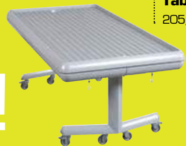
Tabl'Easy fermé 205/98 cm