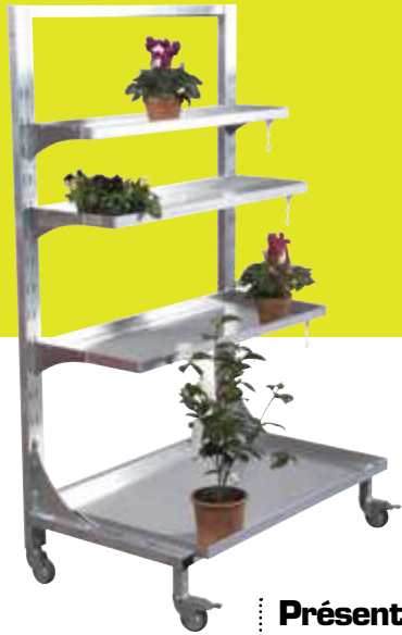
Présentoir linéaire mobile