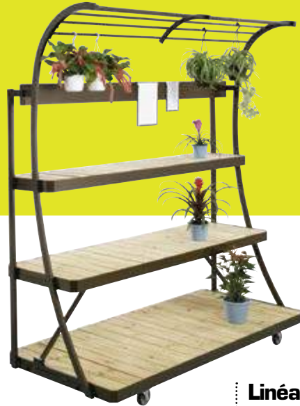
Linéa shop mural