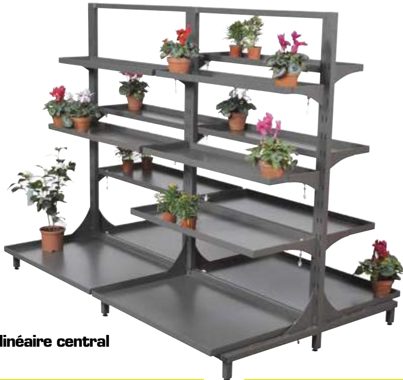
Présentoir linéaire central