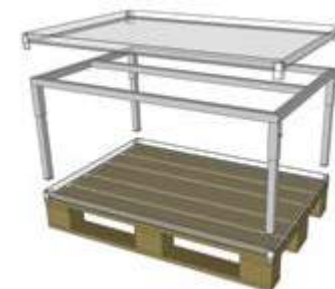
Table bois 90 x 90 ht 20/40/60 cm 150 x 90 ht 20/40/60 cm Option : plateau étanche