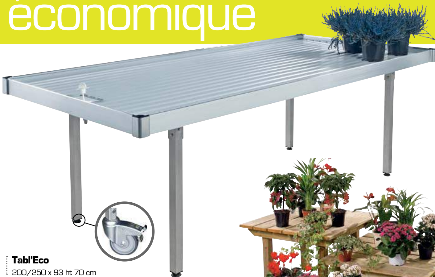
Tabl'Eco 200/250 x 93 ht 70 cm

Le Tabl'Eco est la solution la plus économique pour la présentation de vos végétaux. Doté d'une structure entièrement soudée, d'un bac monobloc étanche, de 2 bords de vidange et montée sur vérins de mise à niveau ou 4 roues folles dont 2 à freins.