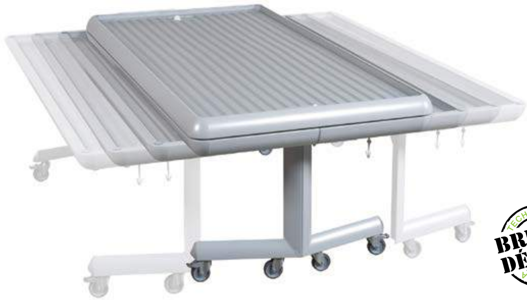
Tabl'Easy ouvert 205/180 cm