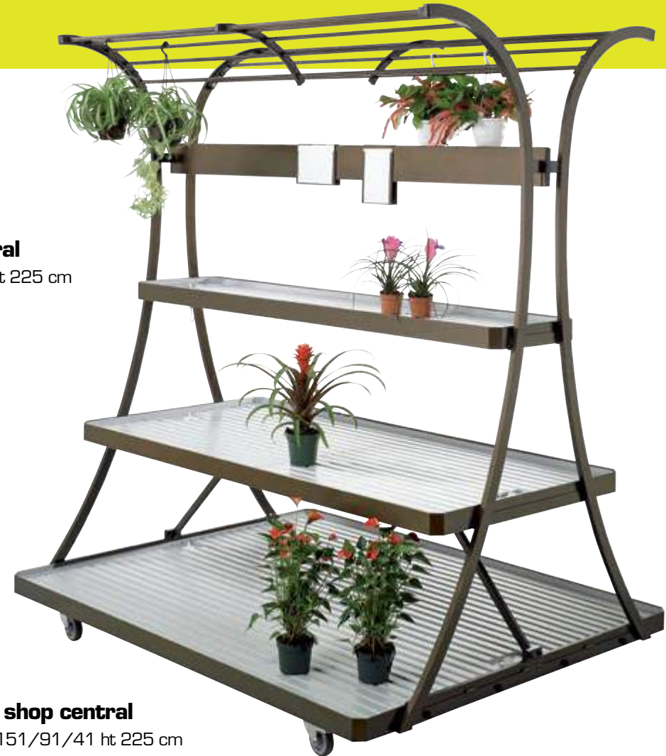
Linéa shop central